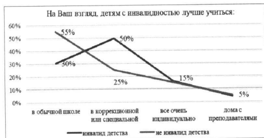
Рис. 2. Предпочтительная форма школьного обучения в связи с временем наступления инвалидности, N=172.

Что касается конкретных достоинств и недостатков обучения в тех или иных школах, то табл. 1 показывает, что в числе достоинств обучения в инклюзивной школе большинство респондентов видят отсутствие изолированности детей с инвалидностью от мира условно